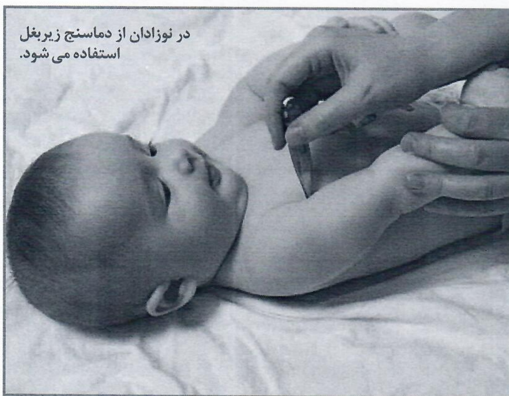
در نوزادان از دماسنج زیربغل استفاده می شود.